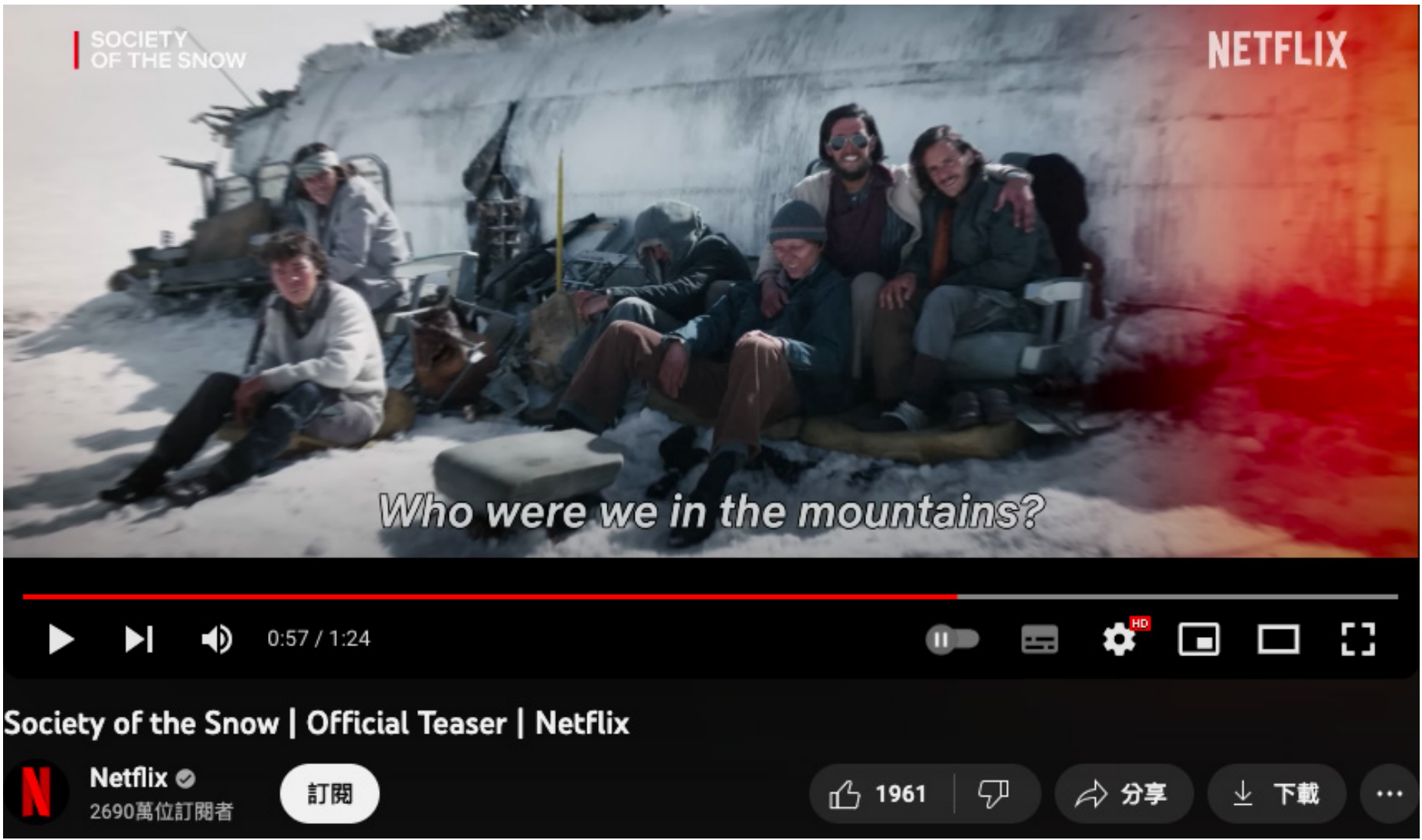
《雪下百態》 (Society of the Snow) Netflix預告片截圖。