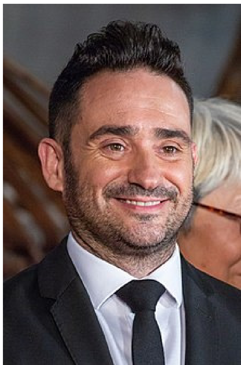
西班牙導演胡安·安東尼歐·巴優納 (Juan Antonio Bayona, 1975-)。

這回《雪下百態》我們將可看到巴優納如何處理面對飢餓、生死攸關、世界末日般的人性掙扎，或是求生利人利他的意志力。威尼斯影展拭目以待。