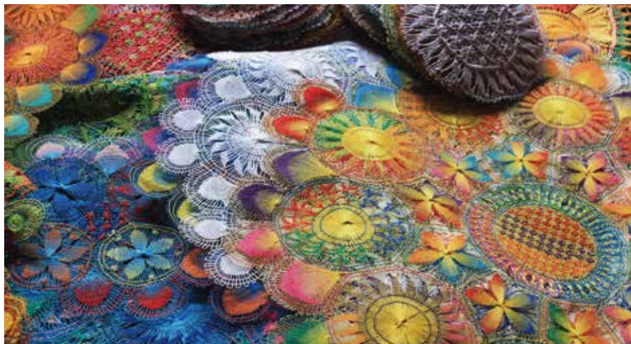
從最初的白色到彩色，猶如萬花筒般多變，都展現出蜘蛛綉的精湛工藝

娘讀悔恨不已，經過數月的折磨，母親看了不忍，要兒子帶她去哈喜娘之前爬樹的森林，結果發現一塊一模一樣而且完整的蜘蛛綉。母親為了安慰兒子娘讀，於是一針一線模仿，拔下自己的白髮當紗線，織成了幾可亂真的蜘蛛綉布。這蜘蛛綉的手工於是傳開。「娘讀弟」：身為母親的娘讀出了兒子(弟)的心意，因此苦心孤詣用針縫織了最原始的色澤：銀白蜘蛛綉。