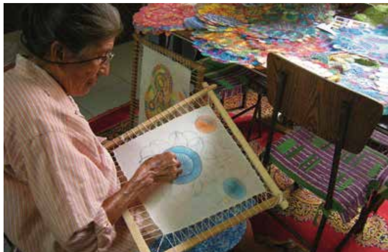
伊陶瓜的婦人，正綉著 ñandutí

蜘蛛綉幾經學者研究，其普遍流通的意思有三：「蜘蛛網狀的白色織品」(這項說法吻合蜘蛛綉的傳說由來)、「蜘蛛的光暈」(符合後來衍生的多變化多織工的蜘蛛綉)或是「蜘蛛群聚之處」(符合蜘蛛綉的發源地)。