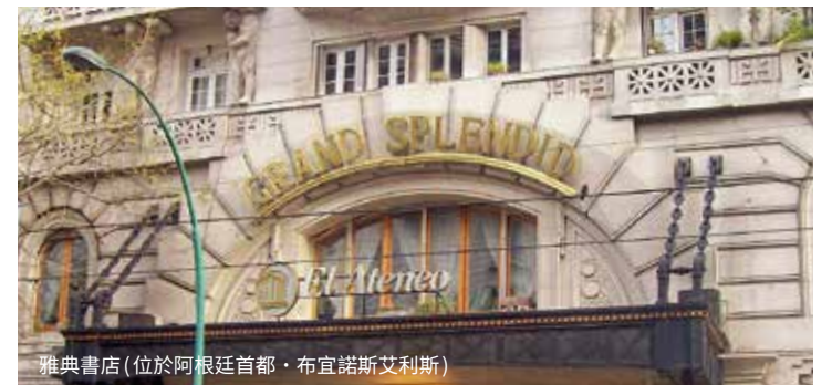
雅典書店(位於阿根廷首都·布宜諾斯艾利斯)

雅典書店的標幟是雅典衛城的圖騰，似也可以聯想到文藝復興的拉斐爾的濕壁畫《雅典學院》的構圖與意涵。圖畫中間，在透視點的兩人分別為柏拉圖和亞里士多德。左、右兩邊牆壁上阿波羅及雅典娜的雕像，代表音樂、文藝、智慧、工藝等。圖畫中的眾人是博學鴻儒：哲學、詩歌、音樂、神學等學者，拉斐爾這幅代表作把不同時期的人集中在一個空間，古希臘羅馬和文藝復興的義大利五十七位左右的文哲與科學專才薈萃一堂。究其意，雅典書店承襲文藝復興鼎盛的文化 and 雅典的傳統，希冀透過閱讀群書的潛移默化，銜接古今中外，世世代代培育健全的身心靈與知識份子。