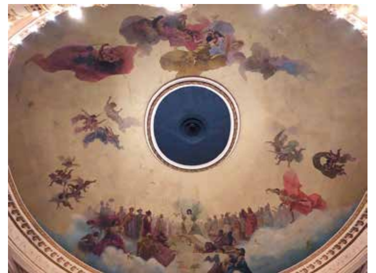
於書店正上方的拱頂油畫